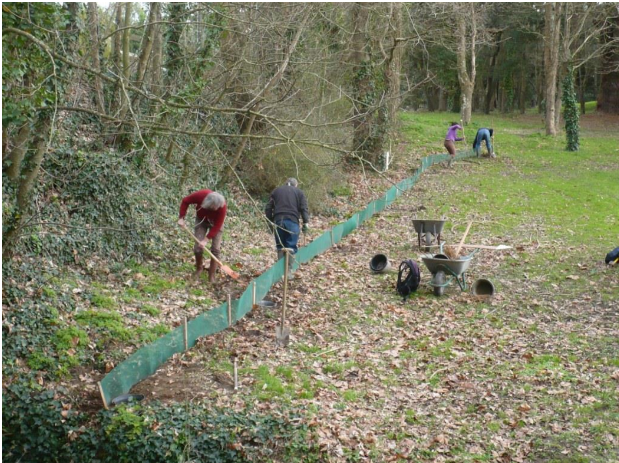
Animation Fréquence Grenouille à Pornic (44)

Mail de l'animateur : wardroannatur@gmail.com