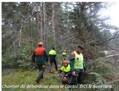
Chantier de débarras dans le Cantal

Jeudi 7 décembre : Chantier d'entretien des mares de Grizols à Saint-Georges avec le Lycée Professionnel Agricole de Saint Flour (Cantal - 15)