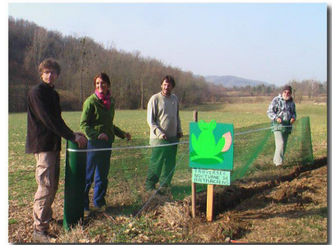
Photo : Dispositif temporaire : filet (panneau « maison ») © Conservatoire départemental des espaces naturels de l'Ariège