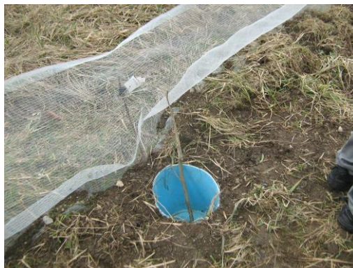
Photo : Dispositif temporaire : barrage avec filet et seaux Réserve naturelle nationale du Bout du Lac d'Annecy Opération Fréquence Grenouille 2011