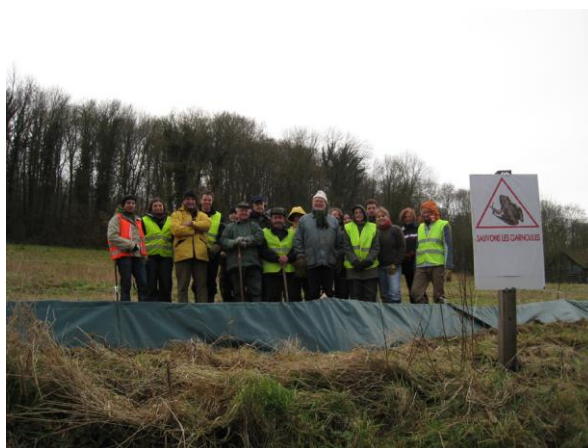
Photo : Dispositif bâche plastique de Ligny-sur-Canche – les membres de l'équipe portent des gilets fluo – Opération Fréquence Grenouille 2009