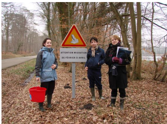
Photo de gauche : panneau installé par l'ONF en forêt domaniale de Compiègne Opération Fréquence Grenouille 2011