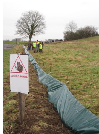
Photo : Installation du dispositif temporaire : bâche plastique de Ligny-sur-Canche – Opération Fréquence Grenouille 2009