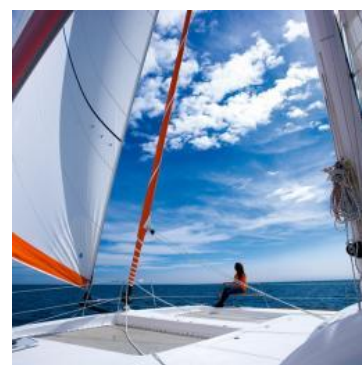
Canet-en-Roussillon / 66 Ven. 24 Mai