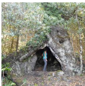
Argiusta-Moriccio / 20 Sam. 25 Mai