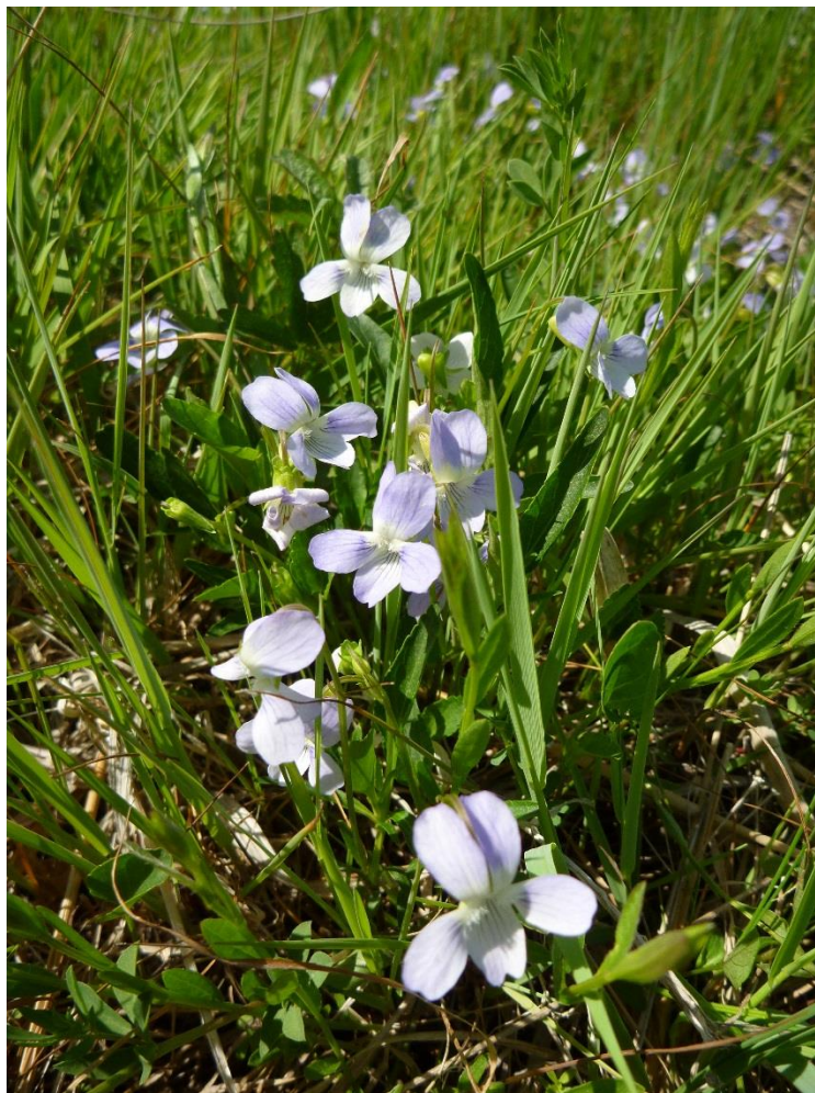
Viola pumila – mare de Paillade – Le Poët

Animation organisée par le Conservatoire d'espaces naturels de PACA