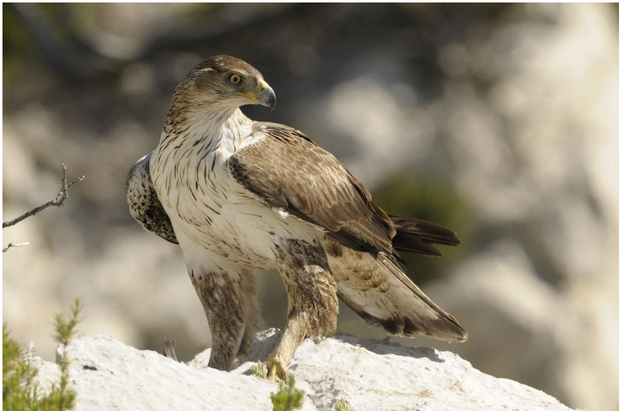
Adulte Aigle de Bonelli

Animation organisée par le Conservatoire d'espaces naturels de PACA