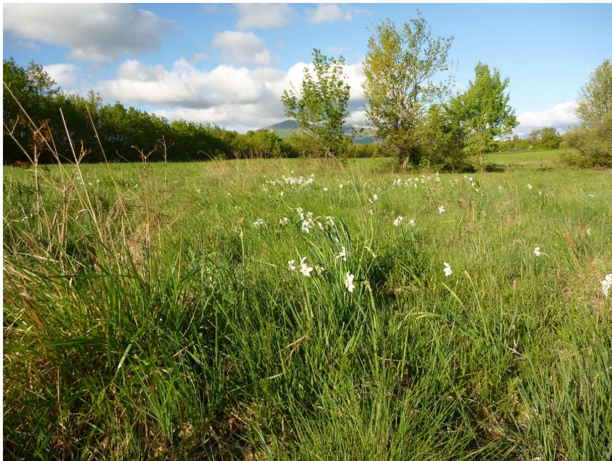
Prairie avec narcissus des Poètes à la mare de la Paillade