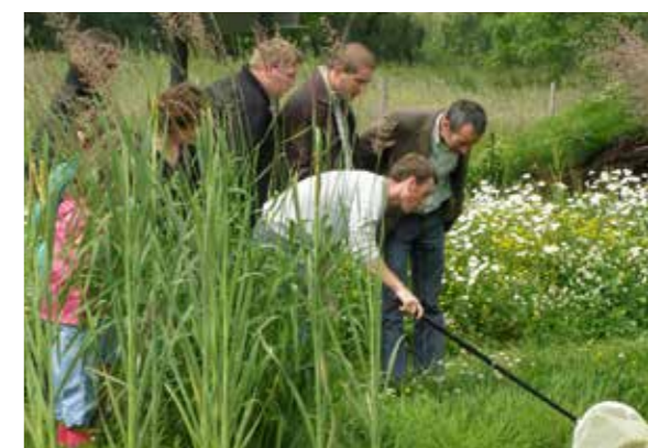
Animation à Géotopia