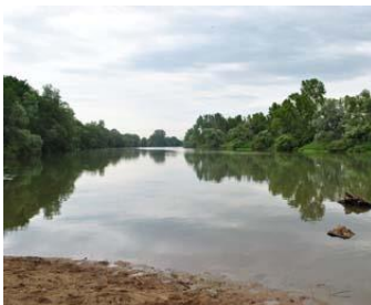
Les prairies humides du Val de Saône constituent un véritable « barrage naturel » en amont de Lyon. Le Conservatoire d'espaces naturels Rhône-Alpes s'efforce de les préserver avec l'appui d'agriculteurs locaux.