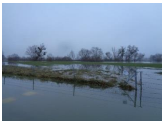
Prairie humide en bordure de la Meuse (Ardennes - 08) gérée par le Conservatoire d'espaces naturels de Champagne-Ardenne

Les Conservatoires d'espaces naturels gèrent de nombreux sites permettant l'expansion des crues et contribuent concrètement à la prévention des inondations.