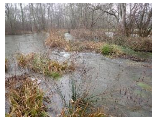
Le site des tourbières de Vendoire (Dordogne - 24) géré par le Conservatoire d'espaces naturels d'Aquitaine