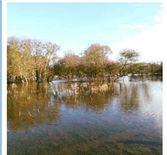
Le site du Marais de Saint-Fraigne (Charente - 16) géré par le Conservatoire d'espaces naturels de Poitou-Charentes.

www.zones-humides.org/agir/ramsar-et-la-journee-mondiale-des-zones-humides