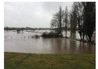
La Réserve Naturelle Régionale de la Moselle sauvage gérée par le Conservatoire d'espaces naturels de Lorraine