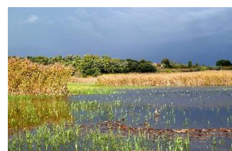
© Gilles BLANC - CEN PACA

16h30 : inauguration de l'exposition « Zones humides » élaborée par le Conservatoire